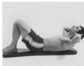
5. CRUNCH ABDOMINAL