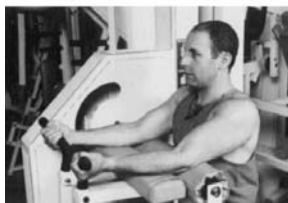
4. CURL DE BÍCEPS EN MÁQUINA