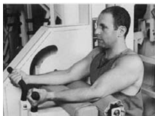
4. CURL DE BÍCEPS EN MÁQUINA