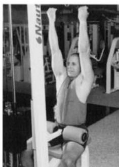
2. TRACCIÓN DORSAL