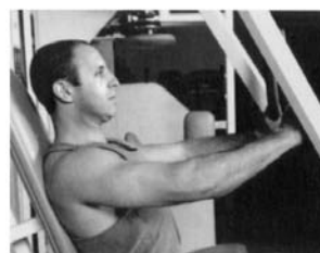
3. PRESS DE PECTORAL