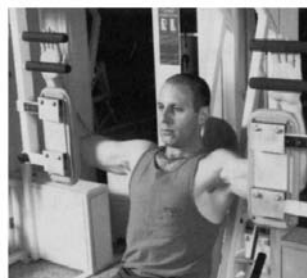
3. CONTRACTORA DE PECTORAL