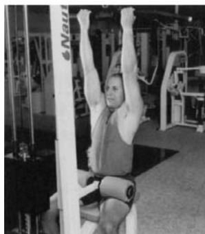
COMIENZO. TRACCIÓN DORSAL