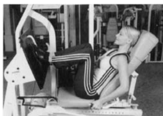
COMIENZO. PRENSA DE PIERNA