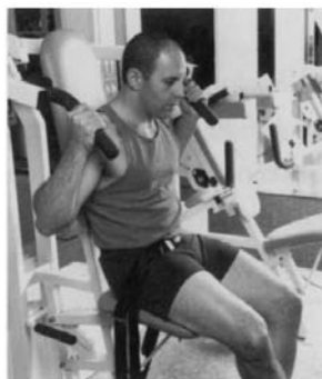
2. PRESS DE HOMBRO